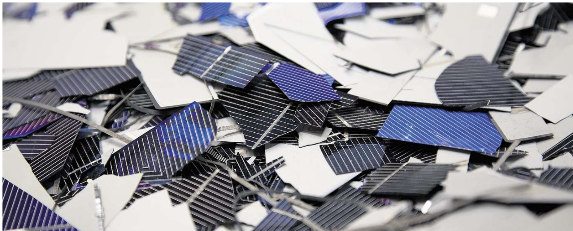
Zellbruch: In verschiedensten Blauschattierungen glänzen die noch beschichteten Solarzellenstückchen. Nach der Reinigung müssen sie zu Siliziumsäulen und -blöcken eingeschmolzen werden.