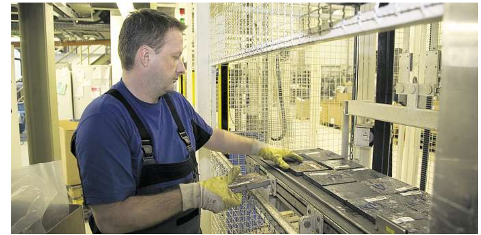
Vieles ist Handarbeit in Freiberg – bei den verschiedenen Stufen des Recyclings wie auch hier kurz vor einem Reinigungsvorgang. Bei der Mutter Solar World arbeiten in Freiberg beinahe 600 Mitarbeiter, die die gesamte Fertigungskette der Solartechnik abbilden.

Photovoltaik: Im sächsischen Freiberg recycelt eine Tochter der Solar World AG tonnenweise kristalline Photovoltaik-Module