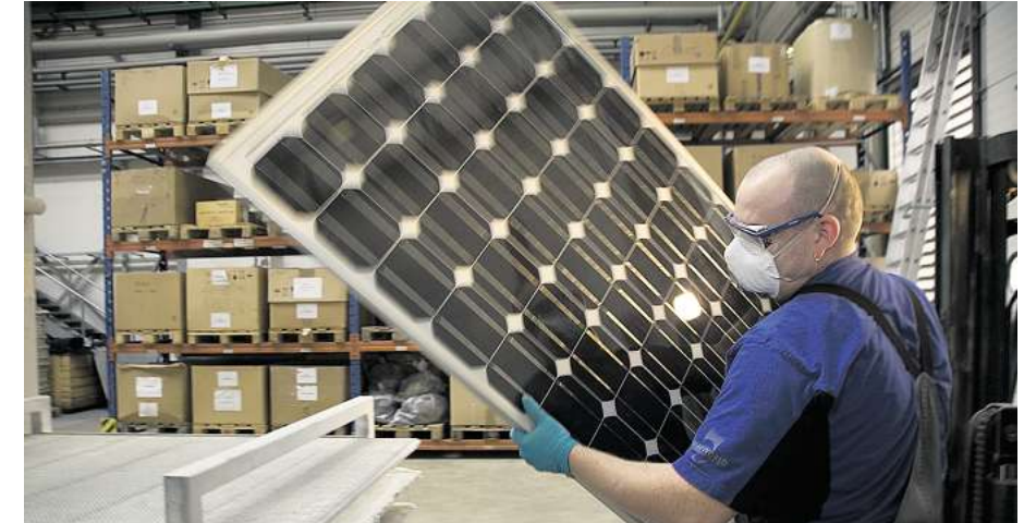
Rund 40 % ihres eigenen Rohstoffbedarfs sichert sich die Mutter Solar World durch Recycling von ausgedienten Modulen, denen man nicht immer ansieht, dass sie defekt sind.