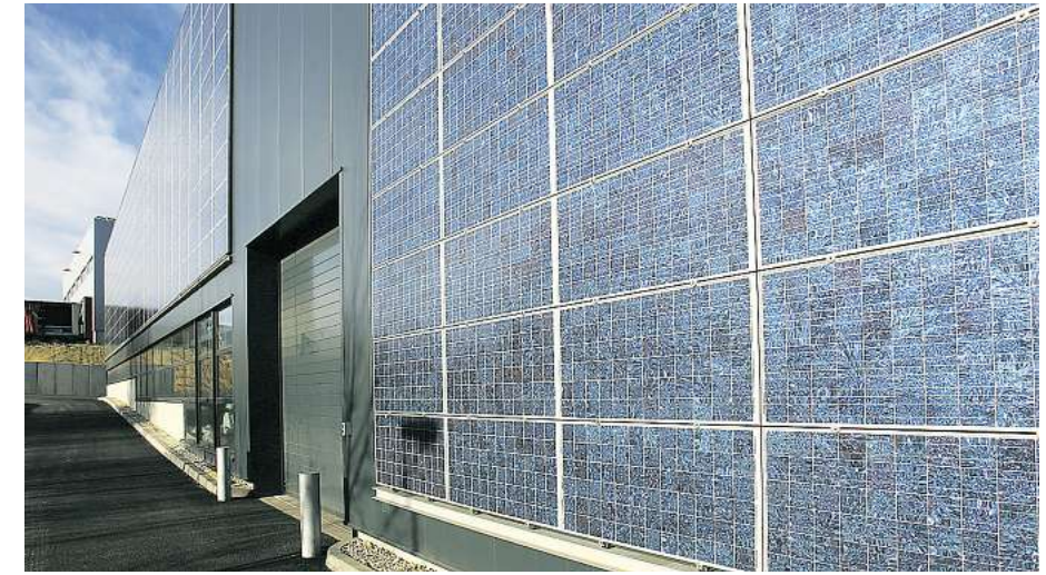
Recycelte Solarmodule sind kaum von neuwertigen zu unterscheiden. Das wird auch an der Fassade des neuen Produktionsgebäudes der Solar Material deutlich.